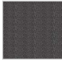
CZARNY MAT (RAL 9005)